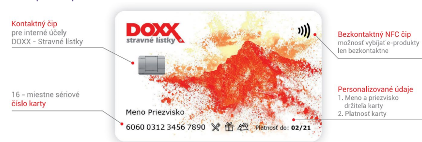
Karta fpoho – predná strana