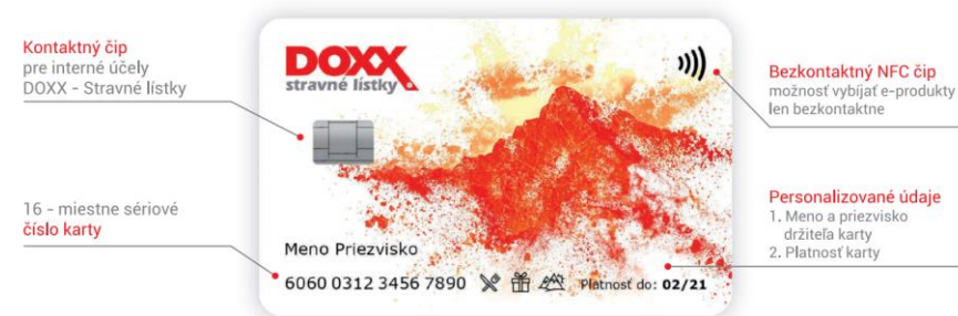
Karta fpoho – predná strana